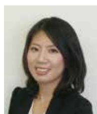
福井社会保険労務士事務所 社会保険労務士

人材、技術・ノウハウや経営理念といった無形の経営上の宝=「知的資産」を、見える化し活用する経営の支援を行っております。 『知的資産経営報告書』作成支援実績約40社。行政書士としての経営法務知識も有り。