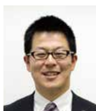
税理士法人みらい経営 税理士・CFP