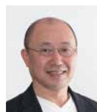
株式会社ミズホネット IT/Webビジネスコンサルタント& プロデューサー

労務リスクを予防するための就業規則などの仕組み作りを提案することで、無用な職場トラブルを防止する支援を行っております。また、助成金を活用した教育訓練などの策定も行っております。